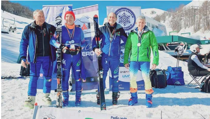
Le gare a Ovindoli

viterbotoday.it/sport/4-titoli-regionali-sci-ovindoli-viterbo-22-2-2026.html