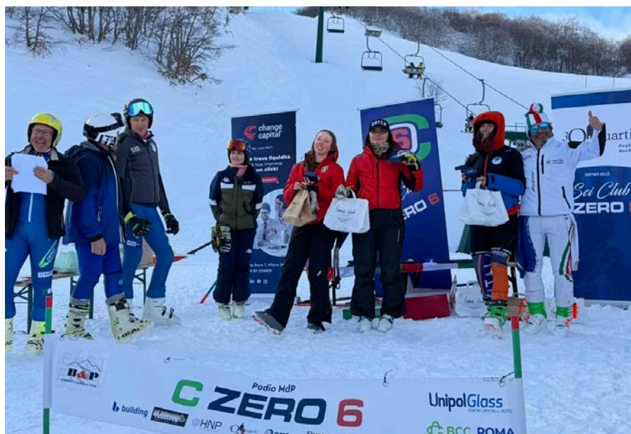
Trofeo Mastermind sci - Podio femminile-2