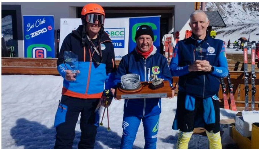
Il podio del Città di Roma

Organizzati dallo Sci club Czero6 si sono disputati sulle nevi di Ovindoli Monte Magnola i campionati regionali Master di slalom e di gigante. Oltre ai migliori sciatori laziali al via anche atleti provenienti da Marche, Umbria, Abruzzo e Campania che hanno dato vita a una splendida giornata di sport.