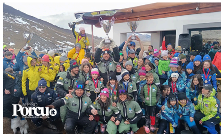
Una foto dello Sci Club MM Crew di Guarcino